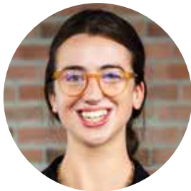
Cô Rogers Giáo Viên Chủ Nhiệm