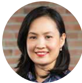
Cô Dương Chuyên Viên Chăm Sóc Và Bảo Trợ Học sinh