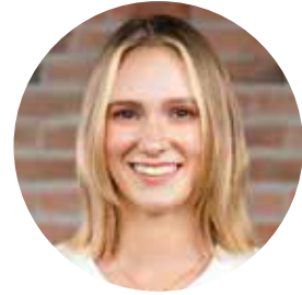
Cô Brosnan Giáo Viên Chủ Nhiệm