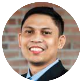
Thầy Ocenar Huấn Luyện Viên Thể Thao