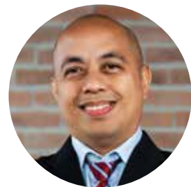
Thầy Siores Huấn Luyện Viên Thể Thao