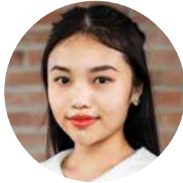
Cô Thư Chuyên Viên Chăm Sóc Khách Hàng